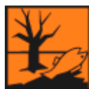
Nebezpečný pro životní prostředí